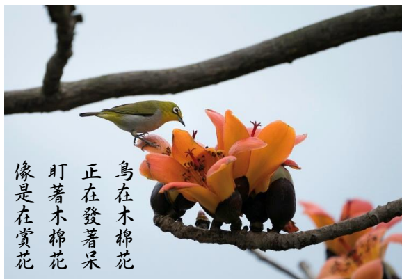
鳥在木棉花 正在發著呆 盯著木棉花 像是在賞花