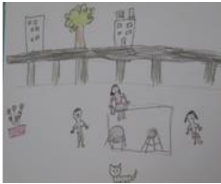
301 曬棉被 張恩捷