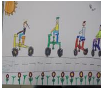
301 陳彥宇 追風車隊