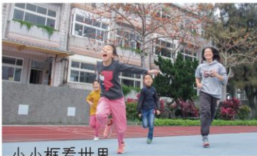
小小框看世界 當我們一起玩攝影

即使攝影展辦完了，然後要停止做夢嗎？不，我們還要一起夢想：未來要像公益平台的志工老師一樣，去到更偏遠的偏鄉小學，把自己從志工老師身上所學到的攝影技巧以及攝影樂趣，分享給更多小朋友認識，讓他們在公益的循環中，也可以有機會像我一樣愛上攝影！