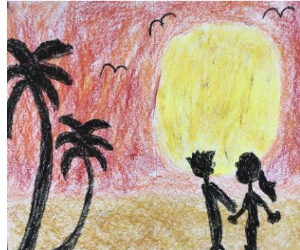
401 劉芊妤 落日剪影