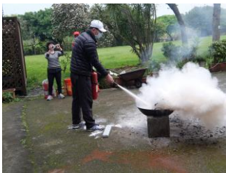
消防演練示範的校長