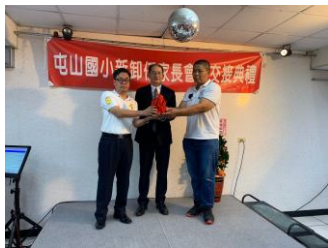
會長交接時的校長