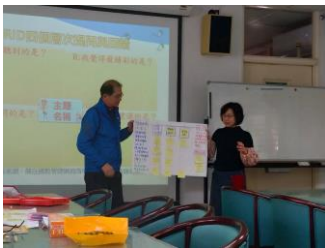
教師研習時的校長