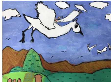
401 葉安哲-吉丁蟲的冒險