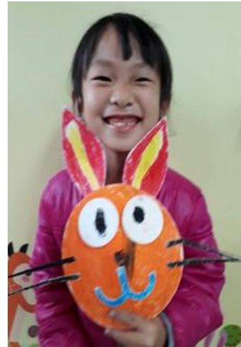
101 英羽彤- 動物面具