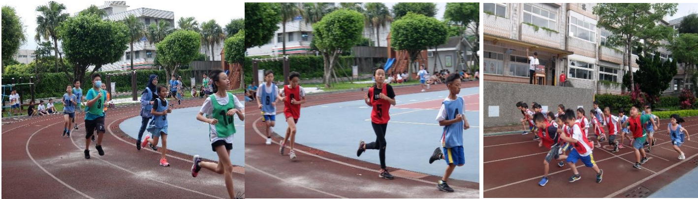
2020 運動會紀念衫徵選

近年來世界各地的馬拉松路跑競賽，如： 台灣的萬金石國際馬拉松 、 台北國際馬拉松 、 日本的東京馬拉松 等，總是吸引世界各地的 好手前往參賽自我挑戰 。小朋友學習也像一場馬拉松，要進行長跑之前要妥善擬定自己的學習計畫，日積月累的實力必定可以讓你在人生的跑道上可以邁開步伐、穩健向前。