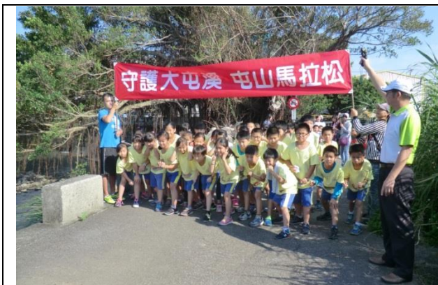
照片說明：準備待緒，鳴槍起跑