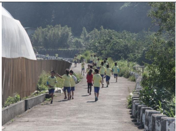
照片說明：有人已經折返了，其他人加油