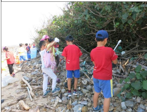
照片說明：努力清除高潮線上的垃圾