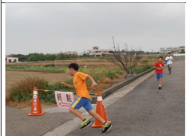
照片說明：終點就在不遠處