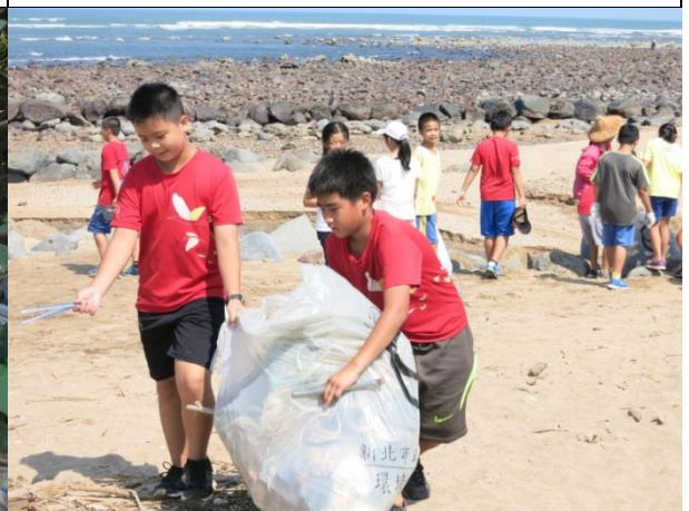
照片說明：垃圾，讓我們帶你遠離海灘吧！