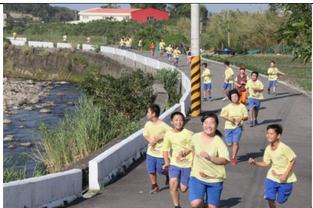
照片說明：跑過家鄉大屯溪