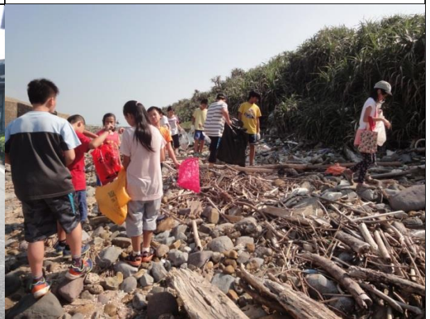
照片說明：全校總動員，還海灘一個美麗的容顏