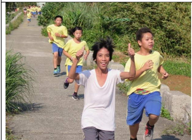
照片說明：馬拉松一極棒！