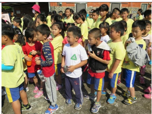
照片說明：結束了，大家來補充水分吧！