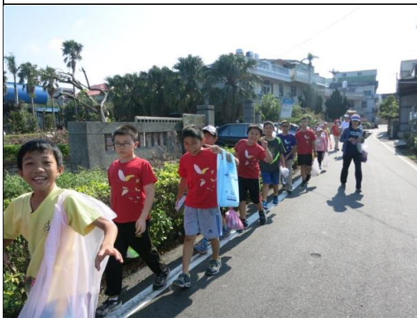
照片說明：步行前往六塊厝海灘淨灘