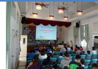
家長日校務座談～了解學校行政為孩子的學習做的安排。