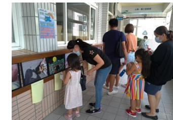
空軍睦鄰攝影展～親子共賞，一同選出最愛的作品吧！