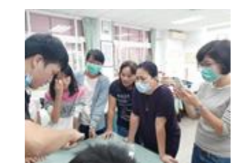
金工手作活動～我學會了，可以回家跟孩子一起做喔！