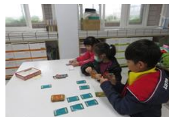
跟著遊戲規則，學習與人溝通與互動，想清楚、不著急。