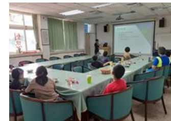
11 月親職講座～上網壞習慣：網路世代的求生指南。