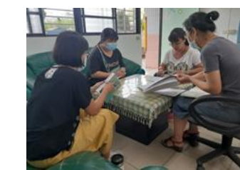
親師懇談～珍惜更了解孩子的機會。