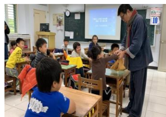
甲骨文真的是刻在烏龜殼上的，老師特別帶來讓你瞧瞧。

這學期幸福天使來敲門，為孩子們帶來了神奇的書法課和桌遊課！幸福天使協會致力於兒童的教育活動，希望提供兒童更多元的學習與更寬廣的視野。