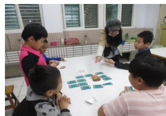
在遊戲中，我們和不同年紀的同學一起玩。