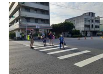
透早上學去～校門口最溫馨親子身影。