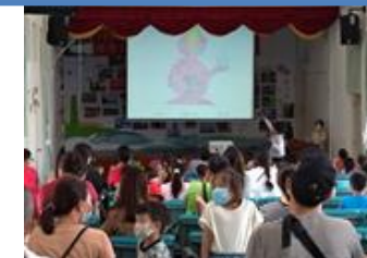
9 月親職講座～如何幫助孩子輕鬆有效學習