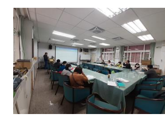
12 月親職講座～注意力不足缺失兒童輔導教養策略