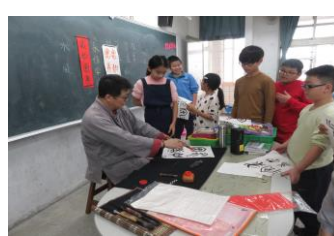
我們可以寫一幅春聯耶，家中第一次有我寫的春聯喔！