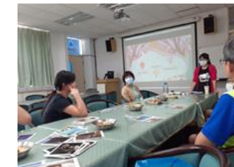
11 月親職講座～經營家庭好關係：在衝突中學習成長。