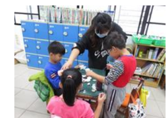
同學媽媽好神奇～同學媽媽教我們做星空瓶。