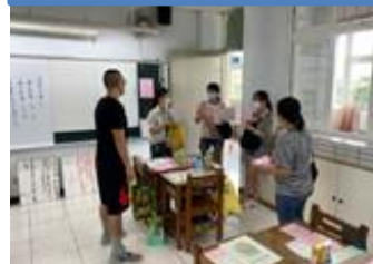
家長日班親會～六年級家長溫馨交流。

這學期試著辦講座類的親職活動，看到參與的家長認真的樣子，講座結束還留下來繼續和講師討論，真是太棒了。歲末年終，來回顧一下這學期辦理過的講座活動，也來看看家長們在學校的身影，孩子的學習有家長的參與與陪伴，是多麼幸福美麗的畫面啊！