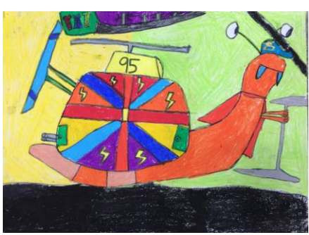
四年一班 盧煥杰 蝸牛的家