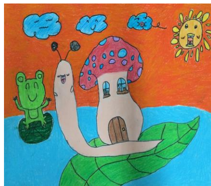
三年一班 羅玟淇 蝸牛的家