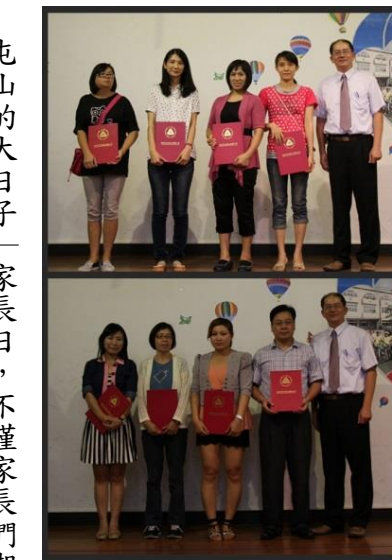
辛苦的志工們，屯山的孩子有你們的照顧與陪伴真的好幸福！

屯山的大日子——家長日，不僅家長們期待，屯山的每位師長們更是期待。李勇敏校長利用這個機會向屯山的家長們介紹未來一年屯山的孩子們在屯山教育的願景及理念。各處室的主任也透過這個機會向家長們表達過去與未來屯山的校園環境、課程、及活動規畫，將讓孩子們在屯山的每一天都是充實且精彩的。 當天，向辛苦的志工家長們獻上薄薄的感謝狀，卻代表屯山師生們滿滿的感謝之意，屯山有你們真的很幸福。 最重要的重頭戲，當然就是家長與導師們的親師座談。當天導師們各個大顯身手用自己的教育專業來與家長們闡述在未來的一年如何