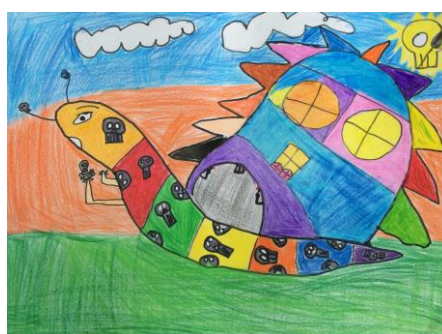
四年一班 林佑語 蝸牛的家