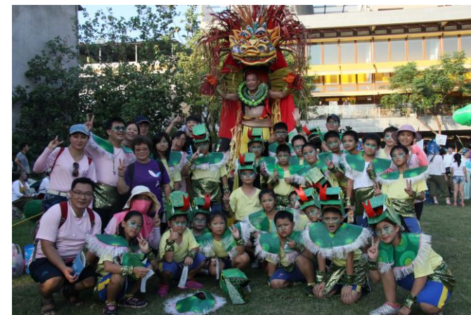
屯山土地公出巡了！大龍、小蛇齊出動，炒熱藝術嘉年華。

而今年，我們依然在沙灘上發現很多人為的垃圾，小朋友在撿拾垃圾的過程中，都很訝異這些垃圾竟會出現在沙灘上。從為了響應每年九、十月的國際淨灘日而發起的淨灘活動，這幾年來持續的努力，我們發現垃圾並沒有減少的跡象。原來，我們還需要做得更多，除了教育孩子們，更需要的的是孩子們將重視海洋生態的觀念帶進家庭與社區。