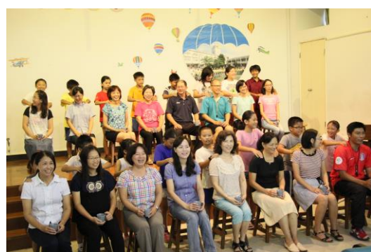
敬師活動在「猜猜我是誰」從老師小時候的照片猜出是哪一位老師掀起另一波高潮。豐富的活動規劃為教師節畫下完美的句點。

九月二十四日這一天屯山訓育組為大家規劃了一系列的敬師師活動。首先登場的「敬師奉茶」活動，讓小朋友體驗傳統的尊師重道，只是簡單的奉上一杯茶，就能讓老師感覺到一切的辛勞都是值得的。緊接著是「幫老師按摩」的活動，其實老師們真的要的不多，只要學生一個溫馨的、關懷的小舉動就能幫老師解除一整天的疲勞。 接下來是讓師生們都非常開心的「敬師九宮格闖關活動」，小朋友要執行九宮格上的敬師行動，盡快完成三條連線，連線完成即可獲得小獎品一份。看孩子講話、逗趣的、表演、及貼心的按摩，讓老師們享受了一段美好的小確幸。