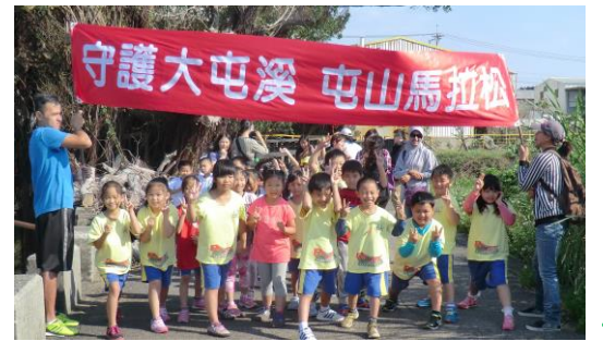
低年級小朋友開心的準備起跑囉！

雖然馬拉松路線歷經好幾次的變革，但，唯一不變的就是要提醒小朋友，這美麗的大屯溪擁有我們必須守護的生態資源。