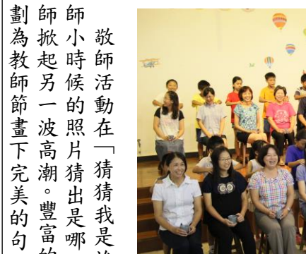
敬師活動在「猜猜我是誰」從老師小時候的照片猜出是哪一位老師掀起另一波高潮。豐富的活動規劃為教師節畫下完美的句點。

屯山的大日子——家長日，不僅家長們期待，屯山的每位師長們更是期待。李勇敏校長利用這個機會向屯山的家長們介紹未來一年屯山的孩子們在屯山教育的願景及理念。各處室的主任也透過這個機會向家長們表達過去與未來屯山的校園環境、課程、及活動規畫，將讓孩子們在屯山的每一天都是充實且精彩的。 當天，向辛苦的志工家長們獻上薄薄的感謝狀，卻代表屯山師生們滿滿的感謝之意，屯山有你們真的很幸福。 最重要的重頭戲，當然就是家長與導師們的親師座談。當天導師們各個大顯身手用自己的教育專業來與家長們闡述在未來的一年如何