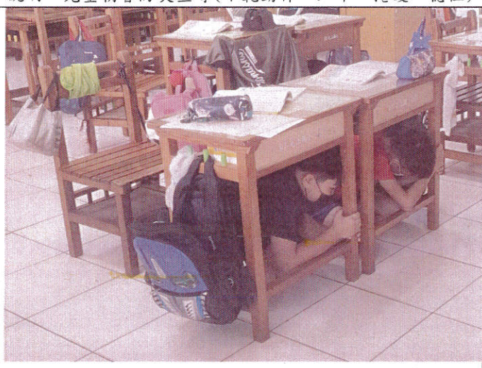
地點：6年1班教室 時間：9月8日 說明：防災預演(學童於教室內進行趴下、掩護、穩住動作)