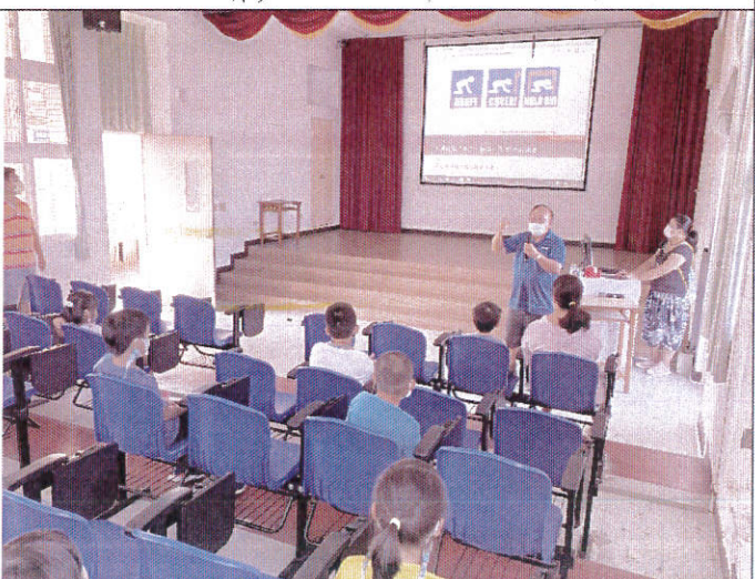
地點：三樓視聽教室 時間：9月15日 說明：兒童朝會防災宣導(英語老師進行防災英語教學—DROP!COVER!HOLD ON!)