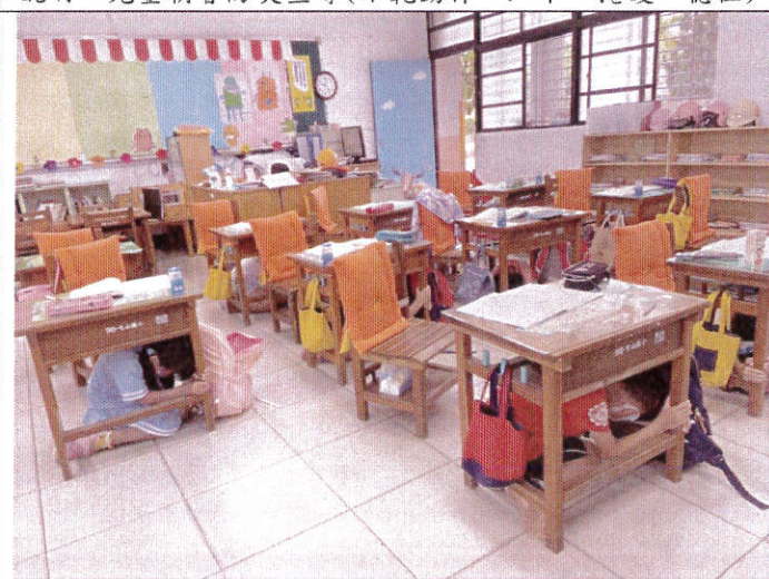
地點：1年1班教室 時間：9月8日 說明：防災預演(學童於教室內進行趴下、掩護、穩住動作)