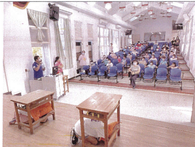
地點：三樓視聽教室 時間：9月8日 說明：兒童朝會防災宣導(示範動作—趴下、掩護、穩住)