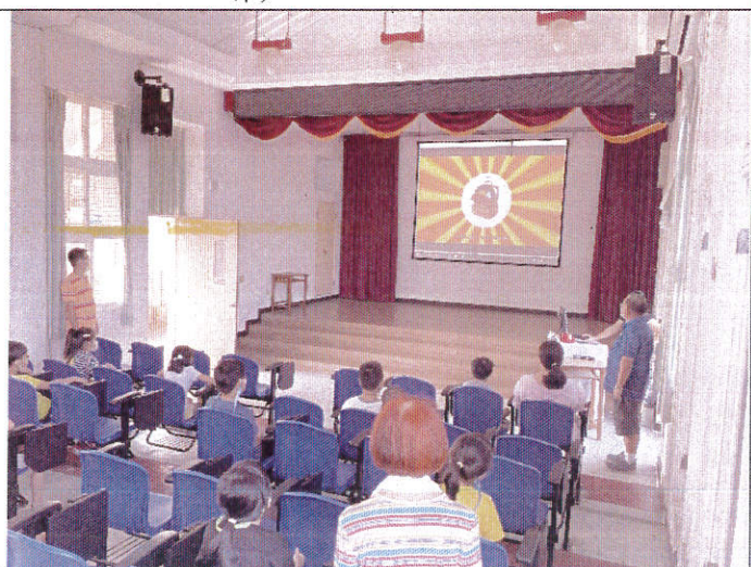
地點：三樓視聽教室 時間：9月15日 說明：兒童朝會防災宣導(影片撥放—緊急避難包，包什麼？)