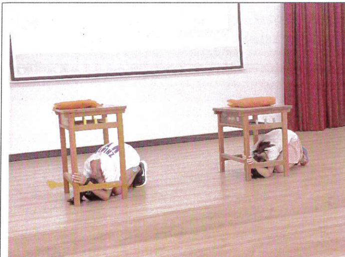
地點：三樓視聽教室 時間：9月8日 說明：兒童朝會防災宣導(示範動作—趴下、掩護、穩住)