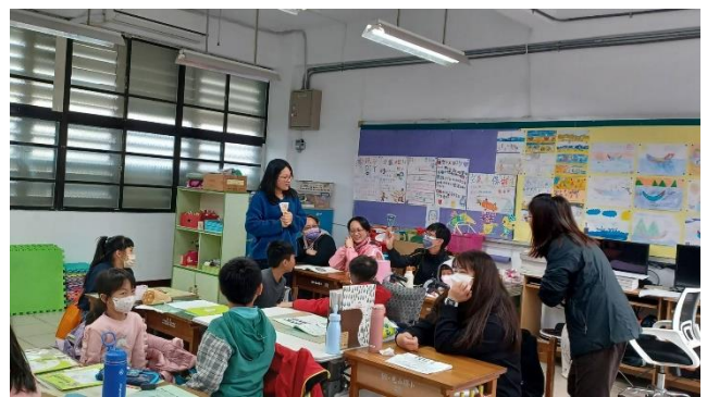
家長入班一起和孩子進行情緒教育課程