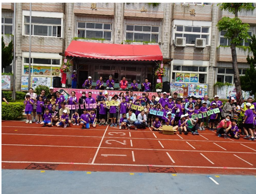
祖孫傳情讓愛延續 親子祖孫活動